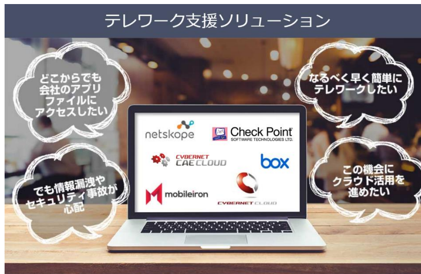
サイバネットの提供するテレワーク支援ソリューション

短時間でテレワークの導入を検討している企業・団体の皆さまを支援するため、弊社で実現したテレワークのノウハウをご紹介しますとともに、各種 IT セキュリティ/CAE のクラウドソリューションをご提供しています。