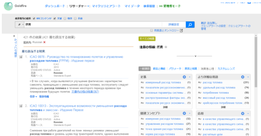
日本語でロシア語の文献をリサーチすることが可能に

日英独仏中の 5ヶ国語に対応したセマンティック検索に、新たにロシア語が加わりました。日本語でロシア語の文献をリサーチすることが可能です。