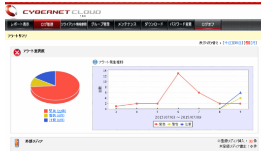
ユーザー操作ログ取得オプションの管理画面

外部記憶デバイスの利用や特定フォルダ内のファイル操作など、社内のセキュリティポリシーに反する操作に対して発生したアラートの履歴を確認できます。