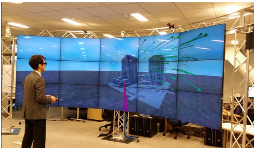
図2: 15面シリンダリカル立体表示システム

1366×768(HD)の46インチ液晶モニタを15台用いて、シリンダリカル(円筒形)に配置した横5.1m×縦1.7mの大型3Dタイルドディスプレイです。大阪大学サイバーメディアセンターが、産学連携拠点と位置づけ、HPCIの普及啓蒙、産業界の利用促進を行う予定である、うめきた拠点に導入しました。