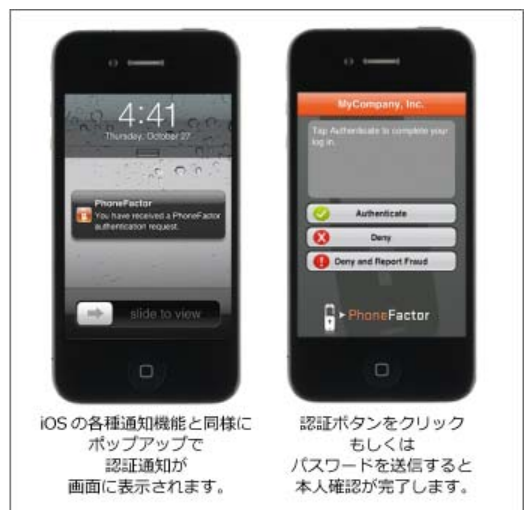
上図：iOS アプリケーション画面イメージ

ユーザーがシステム利用時にログイン ID およびパスワードを入力すると、すぐに PhoneFactor は APNS を通じてユーザーの iOS デバイスにプッシュ通知を送ります。ユーザーはその通知に対して PhoneFactor アプリケーション上で「認証ボタンを押す」もしくは「PIN（暗証番号）を入力し、認証ボタンを押す」のいずれかの動作により本人確認を行います。