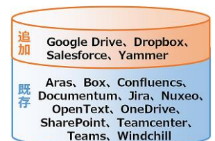
対応可能なシステム

前バージョンから導入された「Indexing Manager」を使うことで、社内外に散在する各システム（Box、SharePoint、Google Drive 等のクラウドストレージから、Windchill、ARAS、Teamcenter といった PLM（製品ライフサイクル管理）システムまで）を横断して素早く情報を検索することが可能です。本バージョンでは、各システムとのコネクタが改良され、索引処理タスクの進捗が把握しやすくなりました。