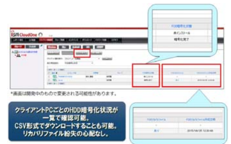
HDD 暗号化状況、リカバリファイルの集約管理画面

サイバネットは今後も、エンドポイント・セキュリティ分野において積極的にサービスを展開し、お客様環境におけるセキュリティ強化に貢献してまいります。